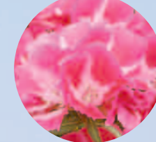
ゴデチャ (6月上旬~6月中旬)