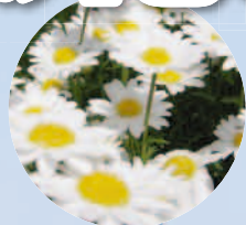
ノースポール (4月上旬~5月中旬)