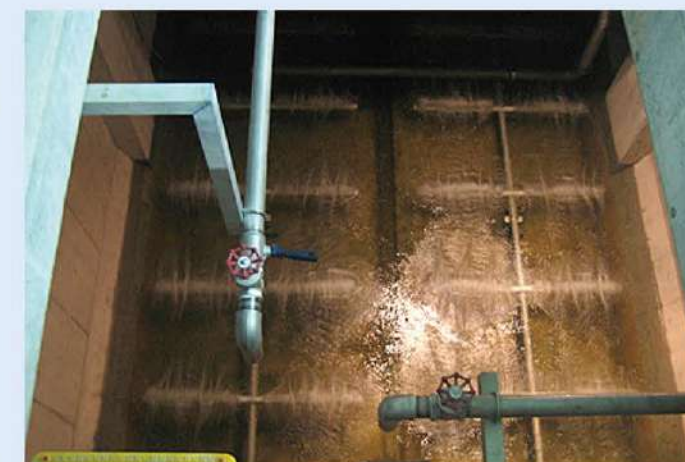
エアレーションタンク (試験曝気)