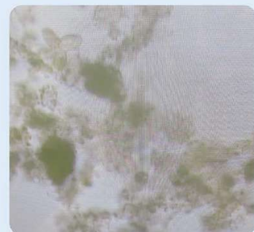
エアレーションタンクではたらく微生物