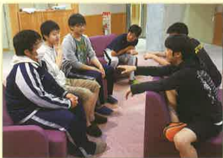
オープンスペースでの談話