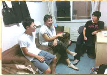
個室での団らん(男子)