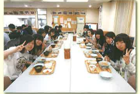
食堂での食事風景(朝食)