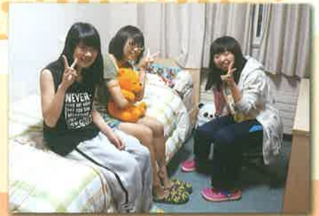
個室での団らん(女子)