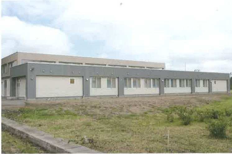
新たに増築された創明寮の外観