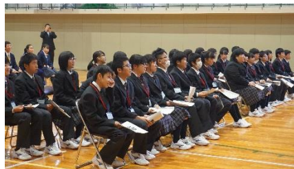
緊張と期待が入り混じった1年次

4月11日(火)に在校生と入学生が顔を合わせる対面式・剣友会オリエンテーションが行われました。剣友会執行部が中心となり、剣淵高校の校内外の紹介、行事や学校生活の心得、農業クラブの活動や農業・福祉の系列についての説明を行いました。その後、全校生徒の紹介と各部活動の紹介が行われました。たくさんの方々の新入生が部活動に加入して、有意義な高校生活を送って欲しいと思います。