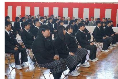
新しい制服が輝いています！