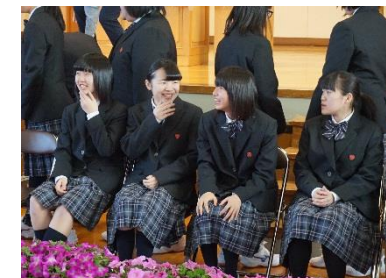
集合写真撮影の一コマ