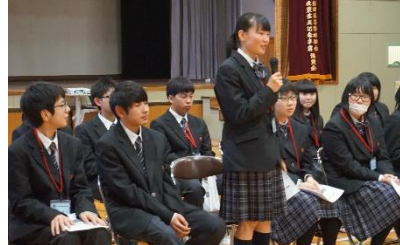
1年次自己紹介の様子