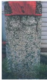
道標 (加塩バス停付近)

加塩バス停付近にひとつの道標があり、 正面、上部に2体の地藏像、そして、「右 あまの山まきのふ山 左いわわき山」右側 面に「こんごう山道」、左側面に弘化二年 (1845)に建立、施主の名が刻まれている。 和泉方面の人たちが大峰山上参りの道 でもあった。