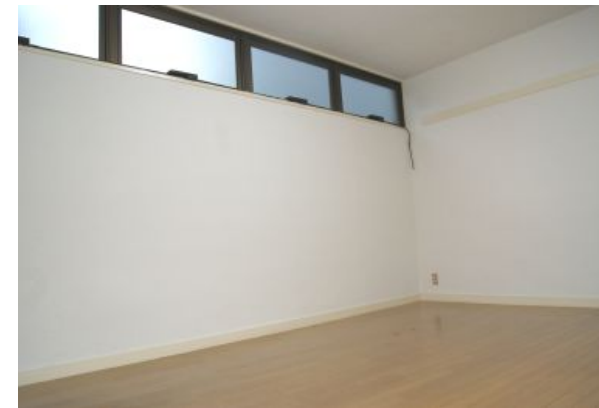
103号室 広めの洋室と余裕の収納