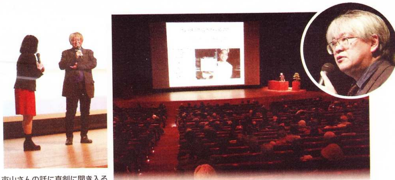
市山さんの話真剣に聞き入る 800人の来場者