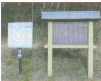
案内板(川崎町教育委員会設置)