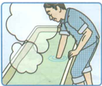
湯加減を確認しましょう