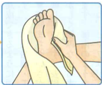
清潔なタオルで、水分をきちんとふきとりましょ。指の間や、爪の周りもきちんとふきましょ。