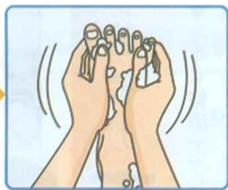
洗うとき、指の間は忘れてしまいがち。足の指を開いて一本一本丁寧に、すみずみまで洗いましょ。