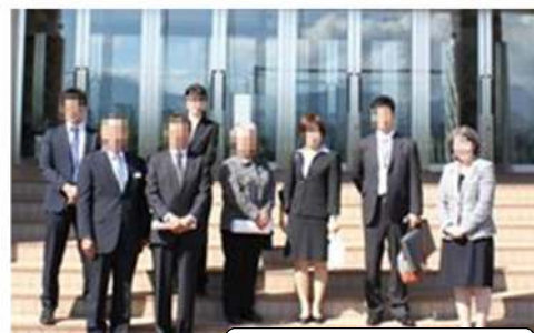
大石田中学校にて

「我が町も、とにかくたくさんの方に学校に興味を持ってもらい、学校に来てもらえるよう声をかけることが第一歩？」