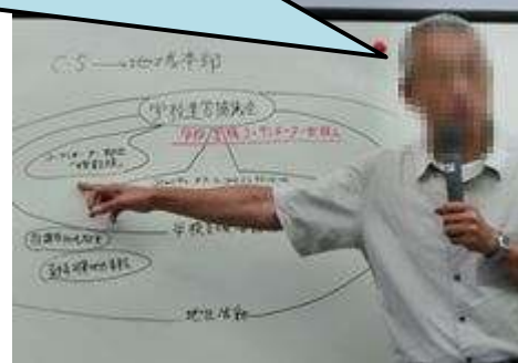
グループ討議後の講評のようす