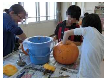
ジャック・オー・ランタンづくり

潮路小がより「地域とともにある学校」となっていけるよう、児童と地域の大人が一緒になって活動する機会を、これからも増やしていきたいと思ひます。