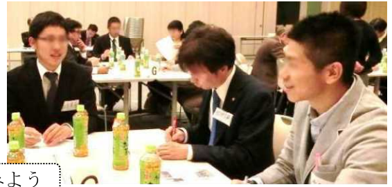
“子供の学びの支援”から、さらに1歩2歩踏み出してみよう