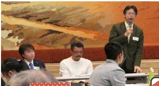
寿都中 CS 委員（発表者）

3校のCS委員が、コミュニティ・スクールの活動に取り組んできた中で感じたことなどを発表しました。