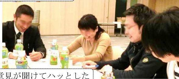
異なる立場の方からの意見が聞いてハッとした