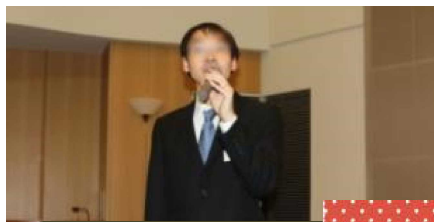
寿都小 CS 委員（司会）

関係者一人ひとりが子供たちのことを真剣に考えている様子を感じ、その仲間の一人であることを嬉しく思いました。