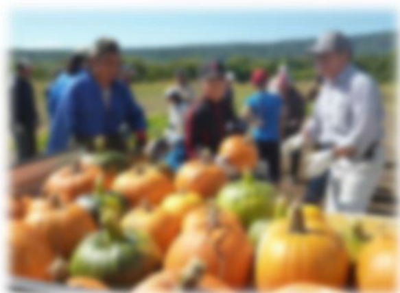
ハロウィンかぼちゃの収穫

朝の読み聞かせ・ブックトーク 警察署・消防署の見学 ハロウィンかぼちゃの苗植え・収穫体験 カキの洗浄・選別・養殖作業体験 まちたんけん 風車の学習 踏み台づくり 紙リサイクル出前授業 浄水場・シークリーン寿都の見学 ミシンの指導 寿都の歴史学習 サケの人工授精体験 ゆべつのゆ見学 お祭りの講話 ランタン・衣装づくり・ハロウィン集会 陶芸体験 ウィズコム図書室見学 薬物乱用防止教室 魚拓体験 子育て支援センター見学 高齢者疑似体験・車いす体験 文化財展示室の見学 キャリア教育 水泳学習 など