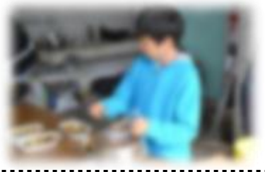
町のイベントに児童が参加