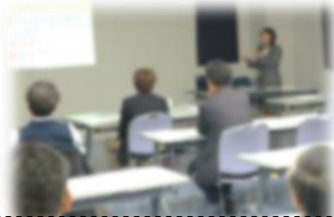
研修会には潮路小・寿中の委員も参加し有意義な意見交換となりました

今年度は定例会議や研修活動をとおして、学校や子どもたちを取り巻く現状について学び、地域としてできることを話し合ってきました。今後は、PTAのみなさんと協力して、児童の成長を地域ぐるみで応援していく体制づくりを進めていきます。