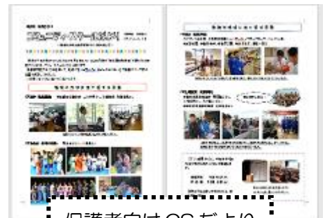
保護者向けCSだより