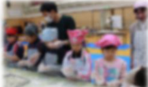
空びん回収やもちつきレクをPTAと一緒に盛り上げます