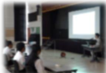
地域の方の職業講話

生徒が寿都の魅力ある人々と関わり、将来に向けて幅広い視野を持ってもらえるよう、意見交換を重ねてきました。今後も、様々なことを感じ、考える年代に差しかった生徒たちが、自分らしく学校生活を送ることができるよう、話し合っていきます。