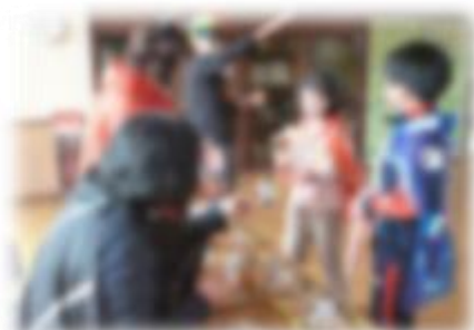
委員が参加したハロウィン集会

今年度も、委員が児童や保護者・教職員と直接関わる機会を持ち、交流を深めてきました。今後は、地域のみなさんが無理のない範囲で、気軽に学校の活動に関わってもらえるよう、さらに取り組みを進めていきます。