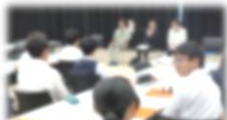
寿都還元プロジェクト