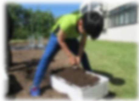
お米の苗植え体験