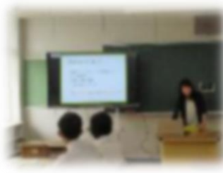
マインドマップの作成