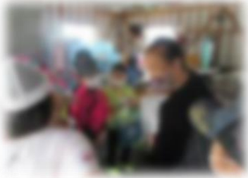
地域の方に支援いただいた授業

昨年度、学校運営協議会で話し合われた内容を基に遠足「ぐるっと寿都」を開催しました。今年度も学校と地域のさらなる相互理解に努めます。