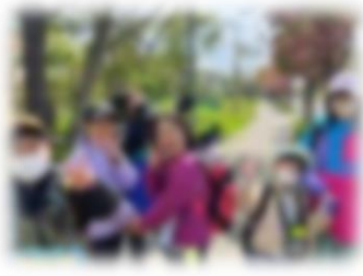
遠足「ぐるっと寿都」