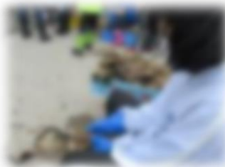
カキの洗浄選別体験