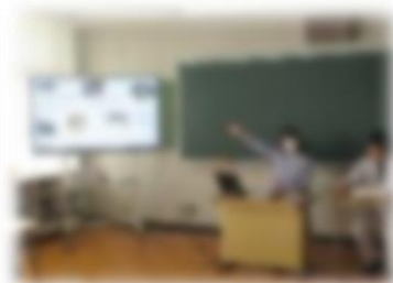
観光プログラムの講評