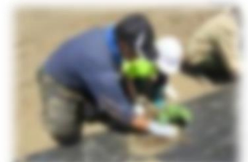
ハロウィンかぼちゃの苗植え