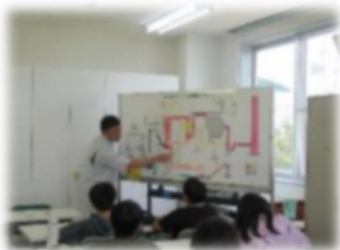
清掃センター見学