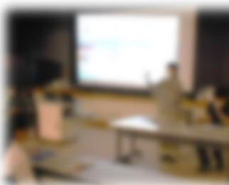
ゲストティーチャーによる講話

委員からのアドバイス、地域の方のご協力で充実した活動を行うことができました。定例会議での議論の中から、「旗の波運動」への参加が実現することができました。