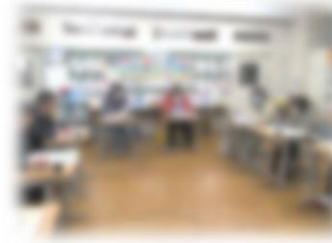
第4回定例会議の様子