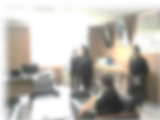
教職員との顔合わせ

コロナ禍で委員と学校が関わる機会が減っていたことから、学校視察等をとおして、教職員や子どもたちとの「つながり」を深めることができました。今後も、学校と地域の相互理解に努めていきます。