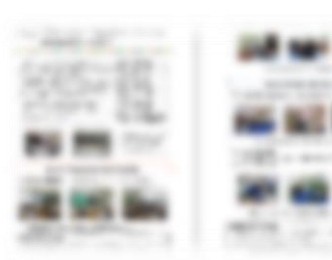
保護者向けCSだより