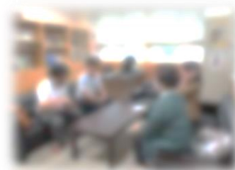
後志教育局によるCS視察