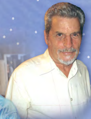
Y. Aharonov 1998 Wolf Prize